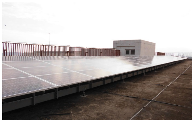
博多工業高等学校

国際L&Dは、不動産事業に環境・太陽光発電事業を組み込んだ「グリーンプロパティ」サービスの提供を通じて、安全・安心で災害に強いまちづくり、地域社会やお客様の資産価値向上と環境価値の創出に取り組んでいます。